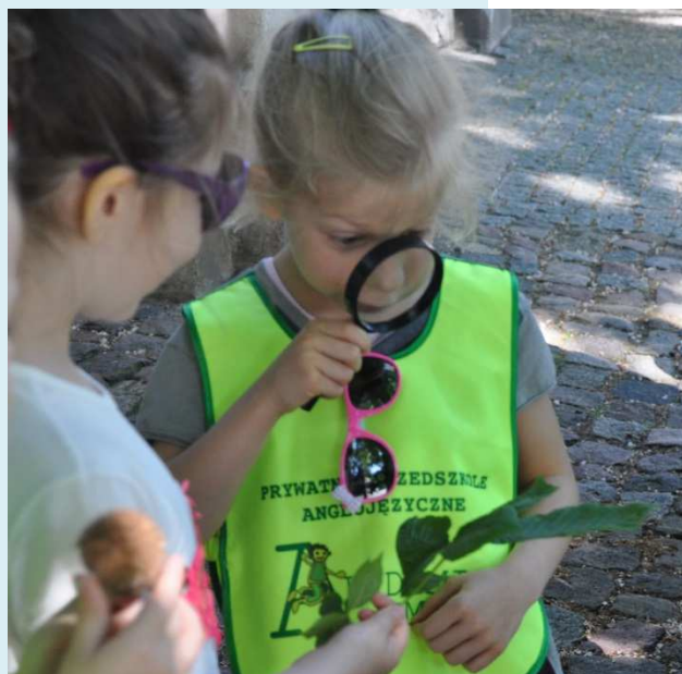
Obserwacja podczas zajęć.

o interdyscyplinarności dziedzictwa Ostrowa znalazł swe odzwierciedlenie w praktyce. Oprócz wycieczek wyraźnie profilowanych pod podstawę programową wybranych przedmiotów w ofercie znalazła się także wycieczka, którą można by nazwać „ogólnorozwojową”. Została ona przygotowana zwłaszcza z myślą o tych nauczycielach, którzy planują skorzystać z serii zajęć (od ogólnych do coraz bardziej profilowanych), a jej zadaniem jest wprowadzenie w tematykę Ostrowa Tumskiego.