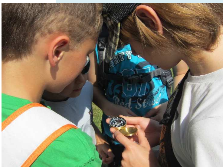
Praca z kompasem to jedna z form aktywizacji, fot. CTK TRAKT.

Jeżeli podstawową zasadą edukacji na rzecz dziedzictwa jest spotkanie z nim twarzą w twarz, to instynktownie najprostszą formą realizacji wydaje się wycieczka z przewodnikiem. Ta jednak może być prowadzona na bardzo wiele sposobów: od klasycznej formy podawczej, poprzez np. karty pracy, aż do form zbliżonych do gry terenowej. Oczywiście nie trzeba przekonywać, że najefektywniejsze będą formy aktywizujące, dzięki którym uczniowie staną się samodzielnymi odkrywcami dziedzictwa.