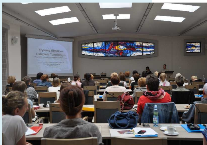
Seminarium dla nauczycieli, fot. CTK TRAKT.

Tumskiego. Warto także dodać, że interdyscyplinarność podręcznika znalazła także odbicie wśród nauczycieli, którzy wzięli udział w warsztatach. Byli to m.in. poloniści (12 proc.), katecheci (12 proc.) oraz nauczyciele geografii i przyrody (5 proc.). Najliczniejszą grupę stanowili natomiast historycy (22 proc.) oraz nauczyciele przedszkolni i wczesnoszkolni (37 proc.).